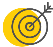
Projeto de Vida